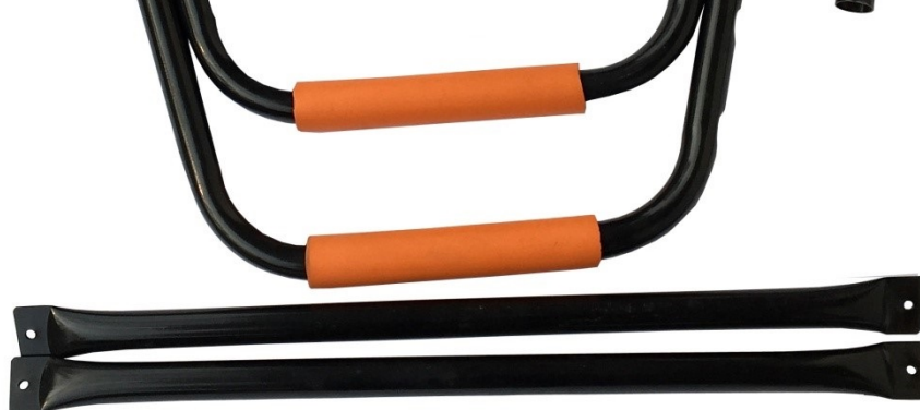
3. Соединительная труба