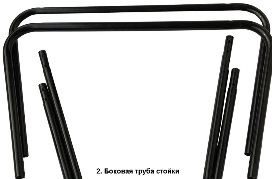
2. Боковая труба стойки